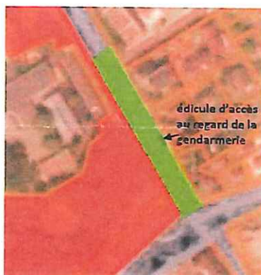
Détail du périmètre de protection : emprise du réseau hydraulique situé sous la chaussée et les trottoirs de l'avenue de Villeroy et édicule d'accès au regard situé près de la gendarmerie