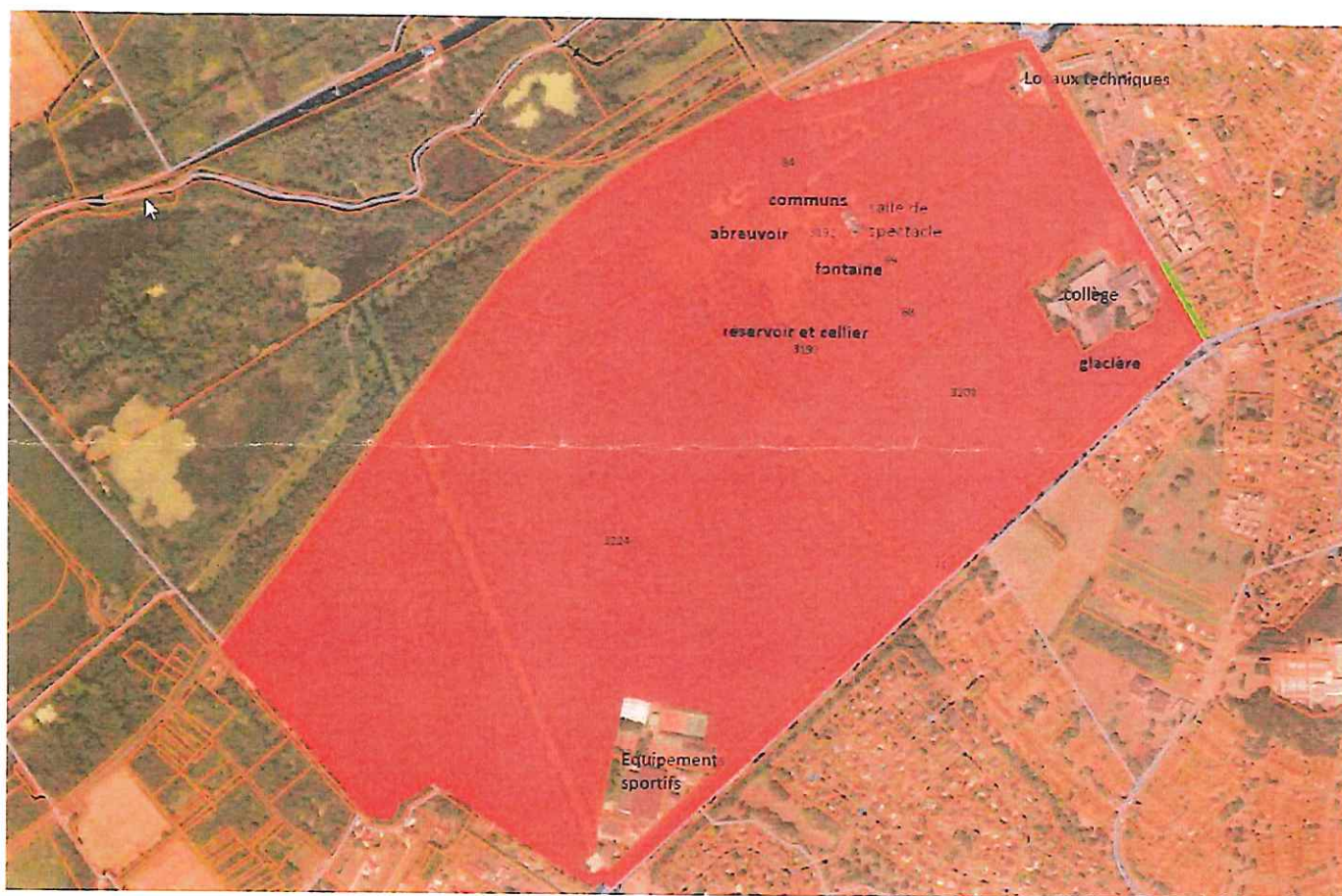
Périmètre de protection au titre des monuments historiques

Plans annexés à l'arrêté n°IDF-2022-BVI-08015 portant inscription au titre des monuments historiques du parc de Villeroy, situé avenue de Villeroy et boulevard Charles-de-Gaulle à Mennecy (Essonne)